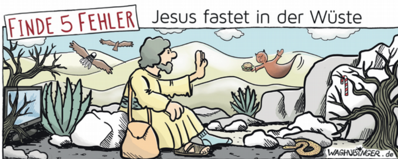
Fernseher, Federball, Socke, Hamburger, Zuckerstange

erzählt die Bibel. Als Jesus erwachsen war und den Menschen von Gott erzählen wollte, ging er vorher in die Wüste. Die Wüste ist zum Leben kein guter Raum: am Tag heiß, in der Nacht kalt, wenig zum Trinken, nichts zum Essen. Aber auch keine Ablenkung. Wohin man schaut, nur Sand und Steine. Jesus ging in die Wüste, um sich ganz auf Gott zu konzentrieren, nichts sollte ihn ablenken, nicht einmal etwas zu essen. Wir hier bei uns haben keine Wüsten. Doch wir können auch dort, wo wir leben, versuchen, uns immer wieder auf Gott zu konzentrieren und uns nicht ablenken zu lassen. Und dabei hilft, auf etwas zu verzichten. Sozusagen Platz zu schaffen für Gott.